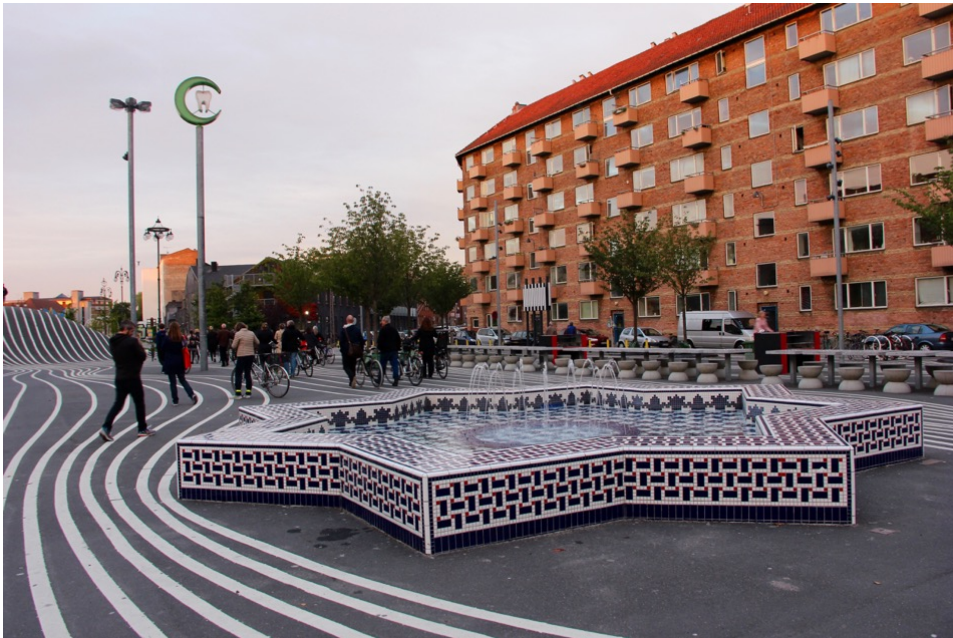
Superkilens marokkanske springvand, ét af de 57 kulturelle symboler spredt ud over Superkilen.